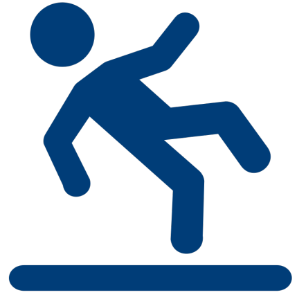
Problemas de coordinación