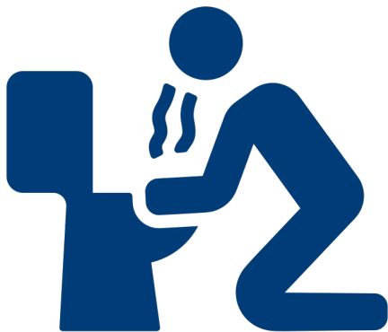
Náuseas o vómito