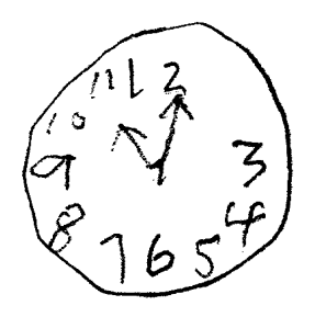
Faltan algunos números

Mini-Cog<sup>TM</sup>, Derecho de autor S Borson. Permitido para uso educacional en el "AFA National Memory Screening Day" en el año 2012. No se puede <sup>3</sup> modificar o usar para otro propósito sin permiso del autor (<u>soob@uw.edu</u>). Todos los derechos estan reservados.